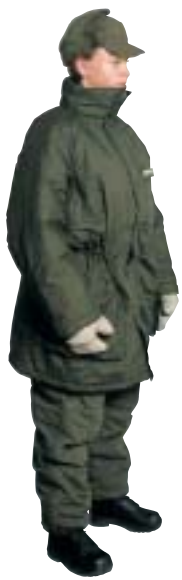
Värmejacka 90 med värmebyxor 90 pälsmössa m/59 och vita tumhandskar