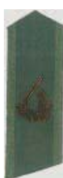
Pansartrupperna (även spegelvänt)