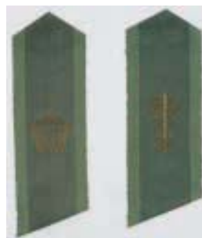
Fortifikations- officer M7676-707000

Fortifikationsofficer och förvaltningsutbildad officer bär respektive (vidare-)utbildningstecken invävt i bronsfärg på kragspiegel m/58 på fältjackans högra kragsnibb.