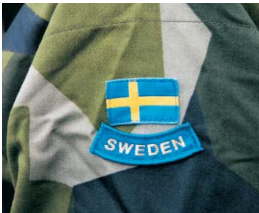
Anbringande av nationsmärke och extra nationsmärke

Personal i övrig internationell tjänstgöring bär även extra nationsmärke i form av en mörkblå, uppåtböjd båge med det till engelska översatta nationsnamnet "SWEDEN" i guldfärg, omedelbart under nationsmärket på fältjacka 90.