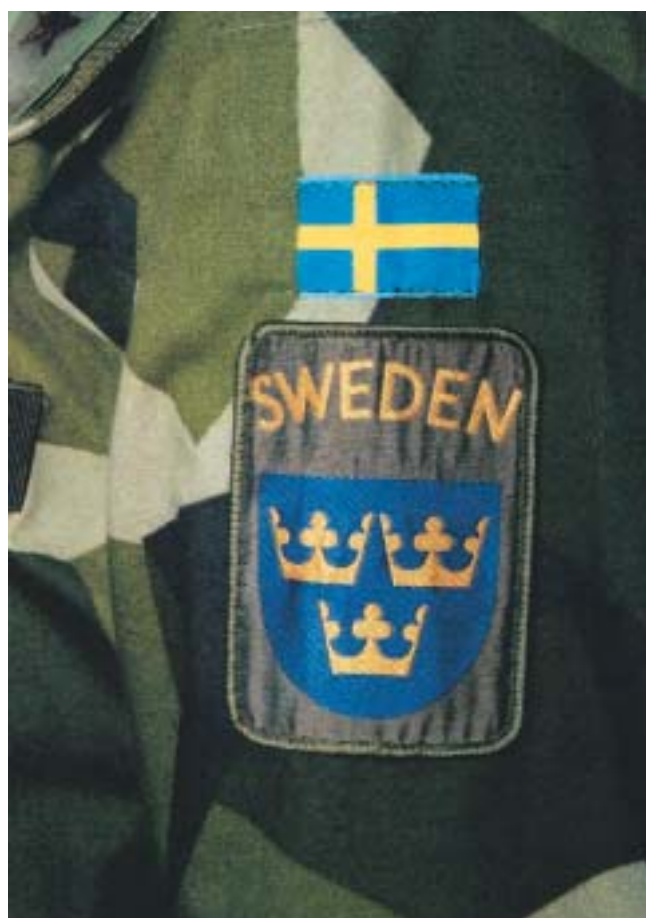
Anbringande av förbandstecken (Utlandsstyrkan)

Exempel på fastställda förbandstecken av textil i Bilaga 2.