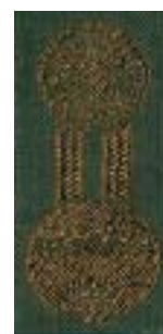
Överfurir - Furir M7671-164000