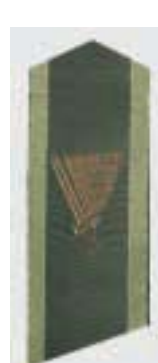
Helikopterflottiljen (även spegelvänt)