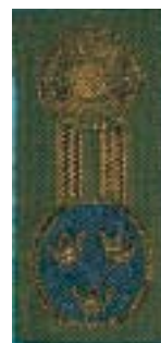
General - fänrik