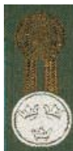
Fanjunkare - sergeant och kadett M7671-163000