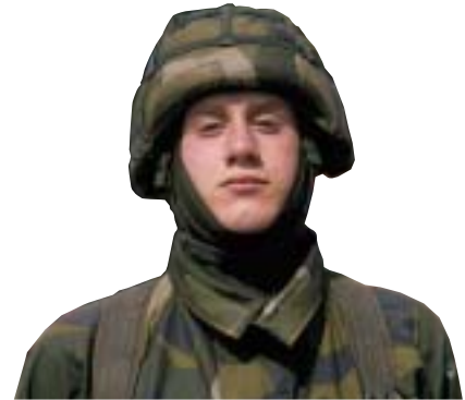
Hjälm 90 med hjälmunderlag och hjälm dok 90