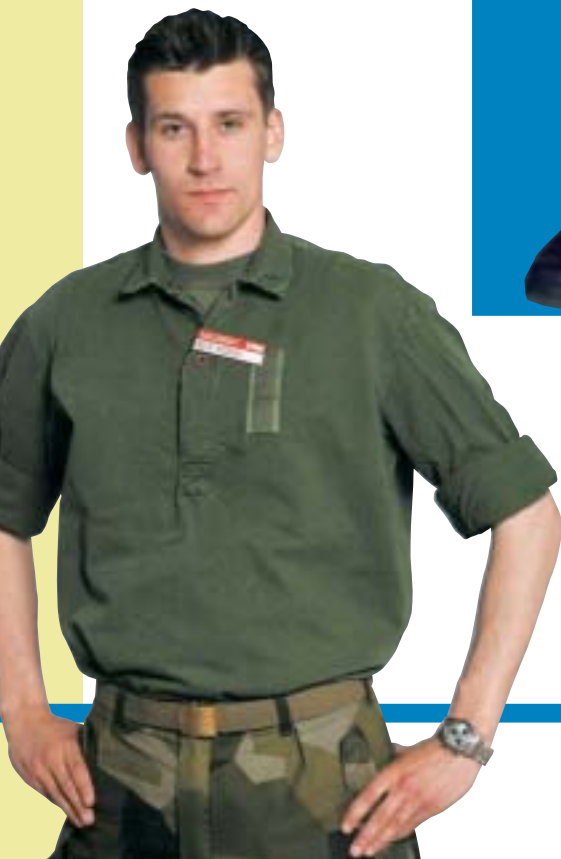
Skjorta m/59 förstärkt med T-tröja