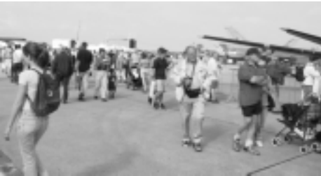
Mycket att se denna vackra dag

Det blev en stor publikfest med flera tusen åskådare, som genom sina upplevelser fick lön för sina mödor att i trafikträngseln ta sig dit och hem. Vår Olle Eriksson var där.