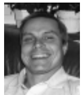
Olle tog alla bilderna

Underrättelseenheten till Bamse fungerar som spaningsradar och sänder även info till andra förband. Kanske det enda som blir kvar av Bamse. Se sid 4.