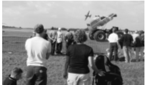
Lågflygande Hercules och bilmonster