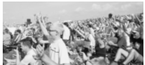
Tusentals åskådare trivdes