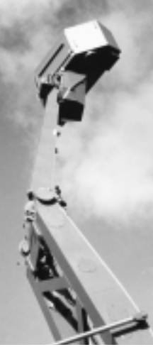
Det väldiga stativet med den kraftfulla antennen till UndE 23.