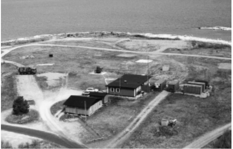
Flygfoto av den "kvarglömda" försöksplatsen på Vaddö. En anläggning där man under många år gjort mätningar och som på sikt kommer att ersättas av en mobil station. Se texten nedan.