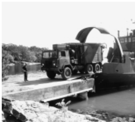
PS 90 färjas över till grupperingsplats på ö i skärgården.

En fältövning under våren kommer att göra de nya officerarna lämpade för att använda rb 70-förbanden taktiskt i skärgårdsterräng.