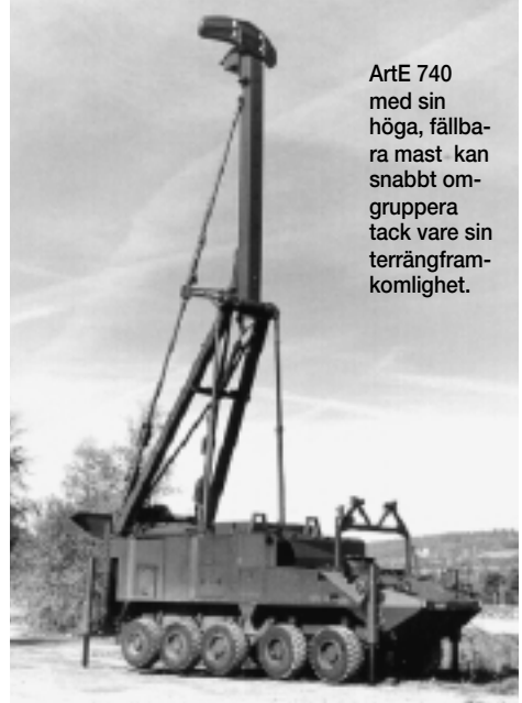
ArtE 740 med sin höga, fällbara mast kan snabbt omgruppera tack vare sin terrängframkomlighet.