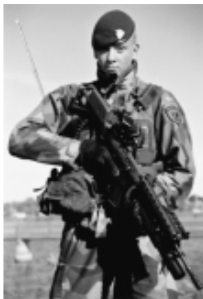
En av de tuffa baskrarna i sin rätta miljö.