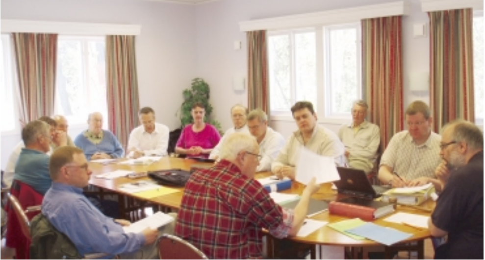
Förbundsstyrelsen och övriga funktionärer sammanträder på Väddö 15 maj 2004