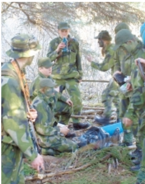
Verksamhet i spaningsbas. Ungdomarna bygger vindskydd för natten.

Fredagen den 16 april startade årets jägarövning för ULv med hämtning vid vakten f d Lv 3 kl 18 00 för transport i buss mot Vaddö. Vid Kasberget drygt sju km från skjutfältet gjordes avsittning - för att därifrån ta sig till fots sista biten. När man kom fram gavs order om att gå i förläggning vid Kaspersodlingen i den norra delen av fältet.