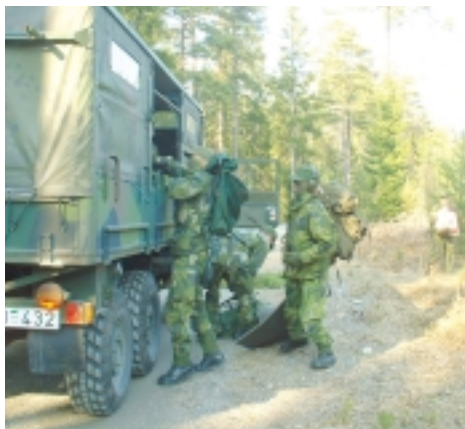
Fordonstransport - skönt för trötta ben

Håkan Wikland skrev